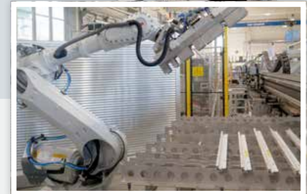
Anwendungsbeispiel: Vertaktstation aus BAZ (Schirmer) Example of use: clocking unit from machining centre (Schirmer)