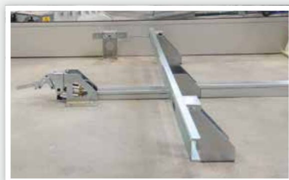
Wagenfixierstation trolley fixation station

Anwendungsbeispiel: Schließteilsetzen und Abstackeln aus zwei Thorwesten-Anlagen Example of use: positioning of locking parts and de-stacking from two Thorwesten machines