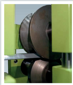
Ensemble de rouleaux Conjunto de rodillos