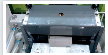
Lubrification automatique Lubricación automática