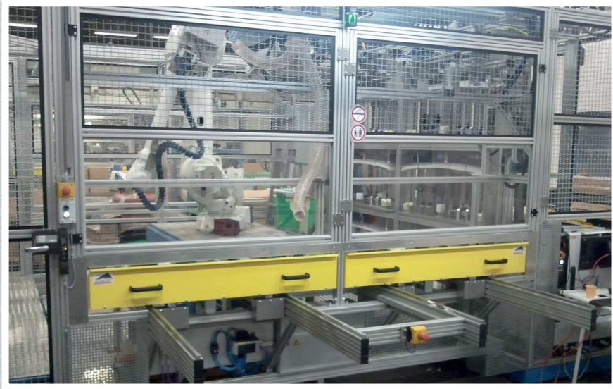
ZK-Kleben von Automobil-Dachspoilern 2C-gluing of car roof spoilers