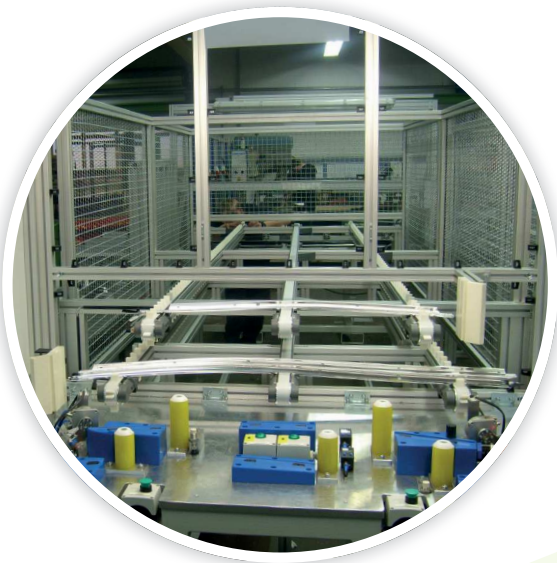
Halbautomatische Klebevorrichtung mit Pufferband semi-automatic gluing cell with buffer conveyor