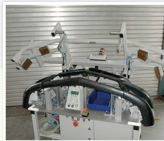
Einkleben von Parksensoren-Adaptoren in Automobil-Stoßfängern gluing of parking sensor adaptors in car bumpers