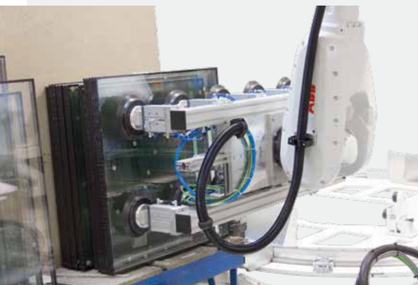
Автоматическое загрузка стеклопакета в оконный элемент Automatyczne wkładanie szymb do gotowych elementów