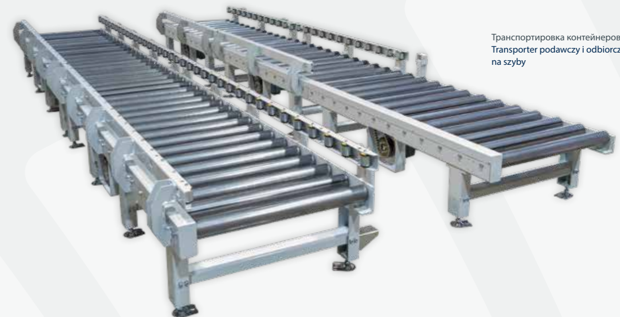
Транспортировка контейнеров Transporter podawczy i odbiorczy stojaków na szyby