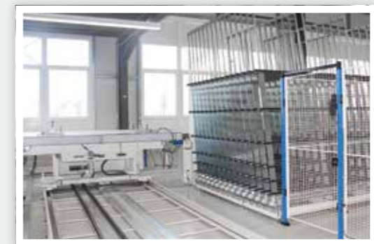
Mise en mouvement des tapis des casiers par la navette Buffer equipado con cintas motorizadas