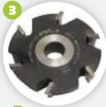
Option Stulpräser sleeve milling cutter