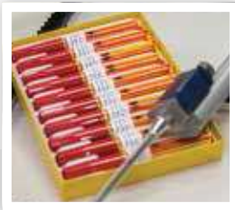
Automatisches Lackieren der Nut nach dem Verputzen optional möglich Automatic groove colouring after cleaning