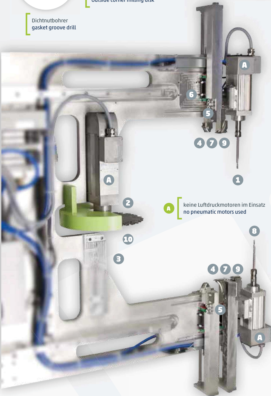
A keine Luftdruckmotoren im Einsatz no pneumatic motors used