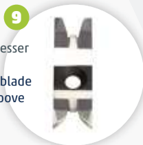
Dual-Sichtflächenmesser glatt/Schattennut dual visible surface blade smooth/shadow groove