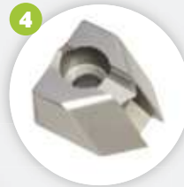
Inneneckmesser 0-70° inside corner blade 0-70°