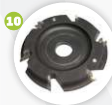
Konturfrässcibe contour milling disk