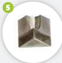
Inneneckmesser 70-90° inside corner blade 70-90°