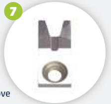
Sichtflächenmesser glatt/Schattennut visible surface blade smooth/shadow groove