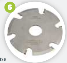
Option Inneneckfräse inside corner milling cutter