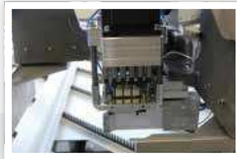
Eck- und Scherenlagerbohren hinge drilling