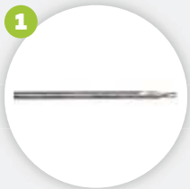
Dichtnutbohrer gasket groove drill