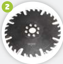
Außeneckfrässcibe Outside corner milling disk