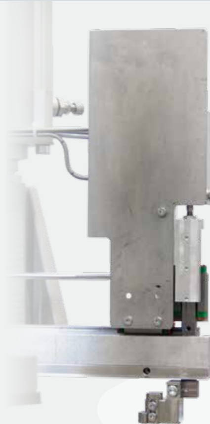
Dichtungs- niederdrücker gasket down- holder