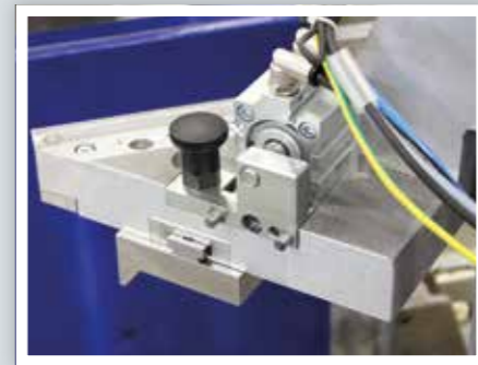
Inneneckbegrenzung inside corner limitation