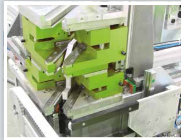
Duplex-Schweißen duplex welding