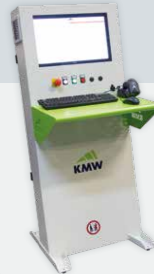
Steuerung über PC mit Windows operated by Windows-based PC