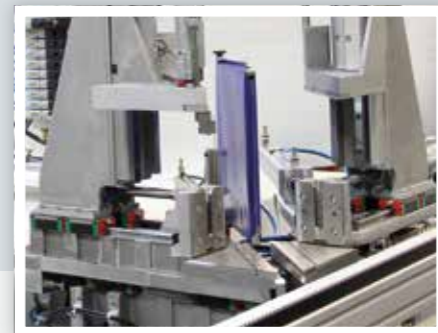
Zulagenwechsel ohne Werkzeuge changing of fixtures without tools