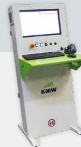
Pilotage par PC sous Windows Pilotado por PC con Windows