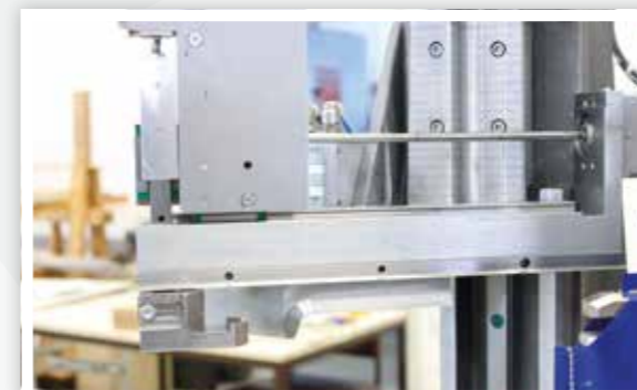
Presseurs pour limitation du joint Prensor de gomas