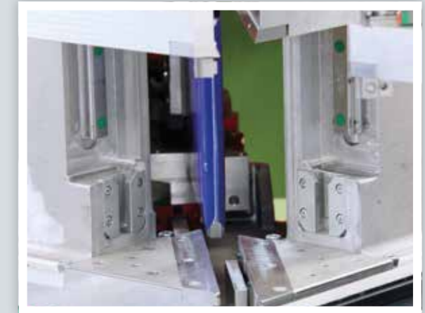
Changement des contre-formes sans outil Cambio de contraformas sin herramientas