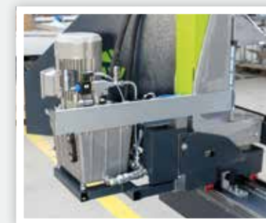
Гидравлический агрегат Agregat hydrauliczny