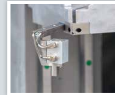
Dichtungsniederdrücker Gasket downholder