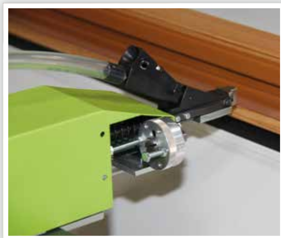
Revolververstellung für Tiefenabschaltung revolver adjustment for depth stop