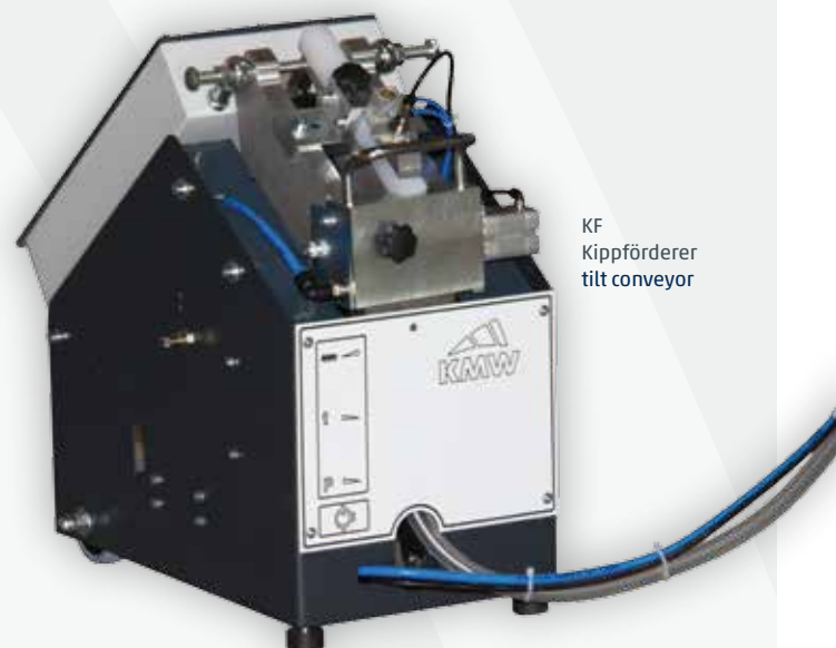
KF Kippförderer tilt conveyor